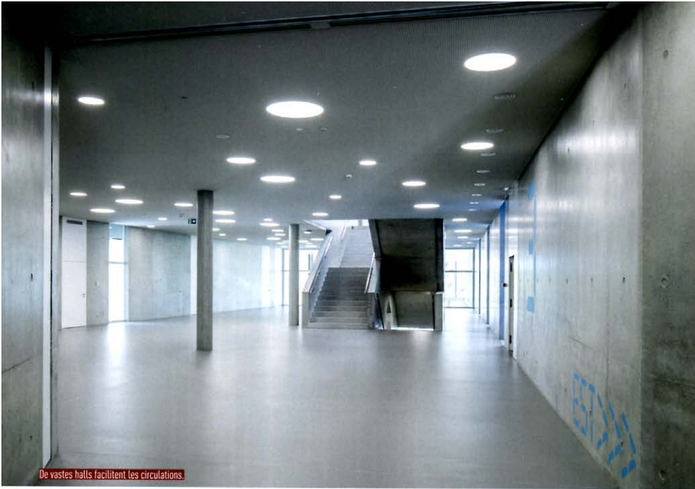
De vastes halls facilitent les circulations.