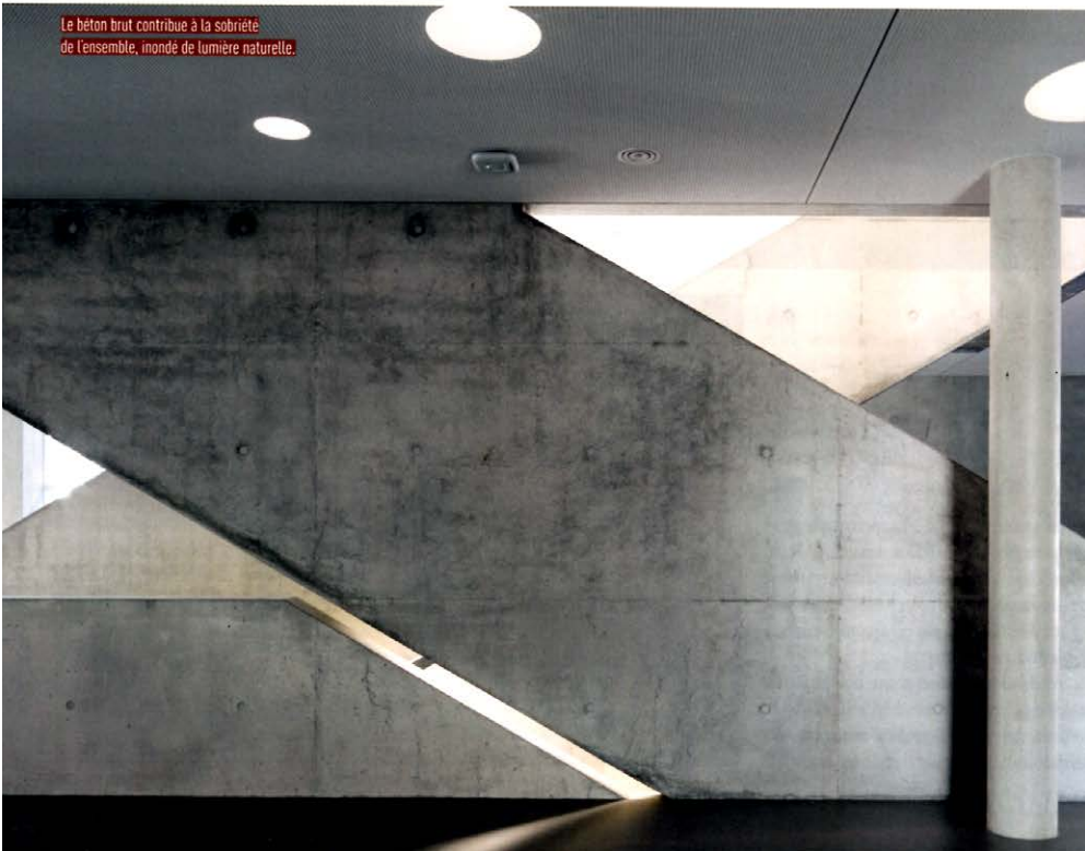
Le béton brut contribue à la sobriété de l'ensemble, inondé de lumière naturelle.